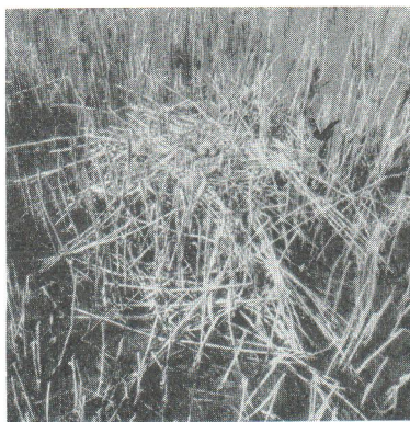
Skrattnåsbo på bladvassrugge.