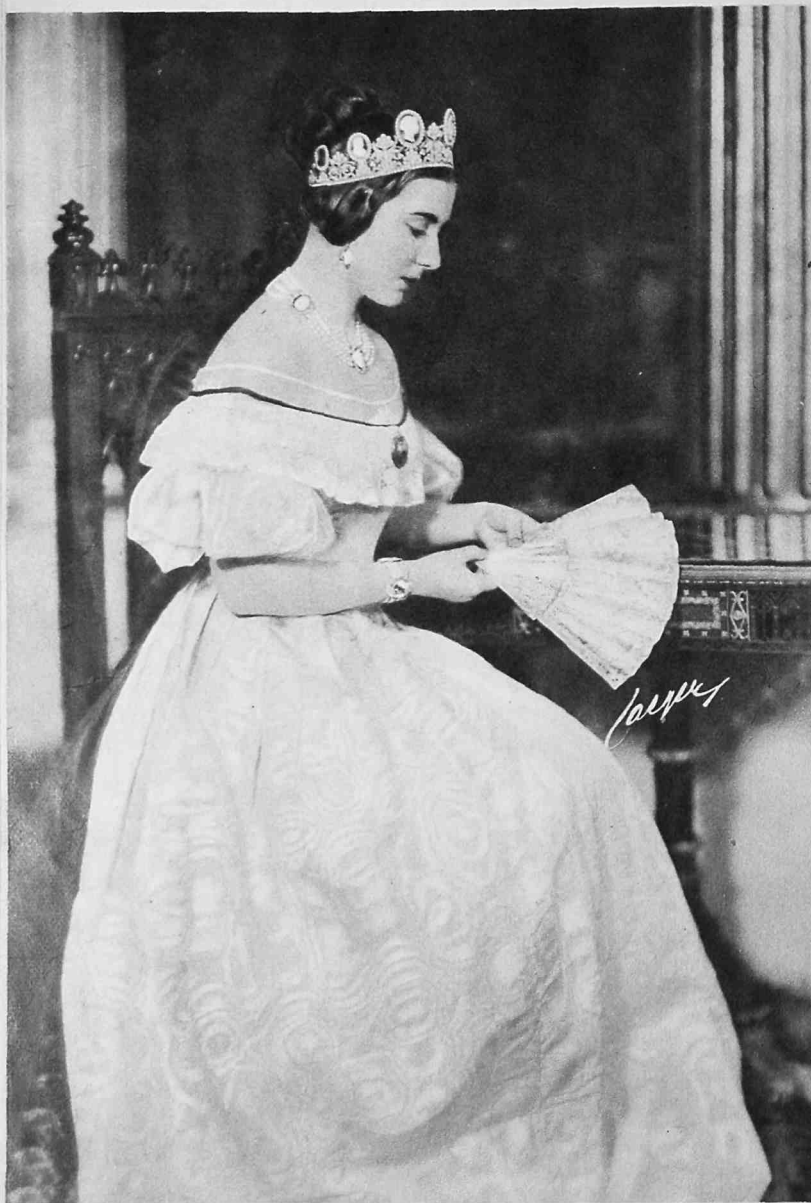
Prinsessan Ingrid som drottning Joséphine representerar empirens hela grace.