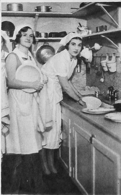
Fick sin första kammarjungfru som åtta-åring.

skulle känna hur roligt det är att kunna göra något för andra. På det sättet har aldrig plikt-känslan blivit svår för prinsessan Ingrid. När hon blev utan mor hade den redan gått henne så i blodet, att hon förstod vad det betyder att göra sin plikt utan tvång.