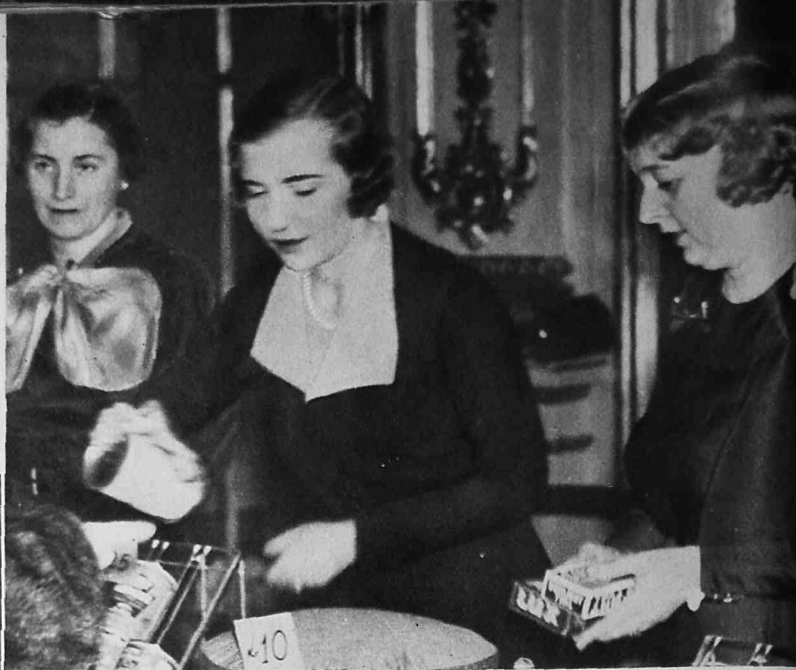
Prinsessan Ingrid vid en basar nyligen — säkerligen det sista fotot som togs före förlovingen.

Vi nämnde nyss, att prinsessan Ingrid alltid varit som en försyn för sina bröder. Men det var inte bara dem hon redan som liten fick vänja sig att tänka på. Som liten omgavs prinsessan med lek och glädje, men det skulle vara allvar även i leken. De många sagospelen på slottet under kronprinsessans regi var icke endast upptåg. Prinsessan var sagoprinsessa, men som sådan fick hon lära mången sens moral, som kanske annars hade varit svår att förstå för den lilla. När det gällde de första handarbetena, som hon fick knäpa ihop, var det inte för hennes eget nöjes skull, utan fastmer för att hon skulle